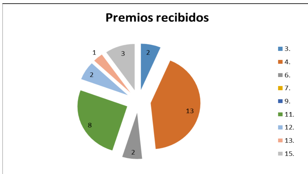
Fig. 2- Contribución del CEMARNA a los objetivos de desarrollo sostenible desde los premios recibidos.

El CEMARNA, en los años 2017-2018 alcanzó un total de 20 premios, los que contribuyeron fundamentalmente a los Objetivos 4 y 11, según se aprecia en la figura 2. Estos premios se obtuvieron como resultado de la presentación de trabajos en: el Evento Técnico del FORUM de Ciencia y Técnica Municipal y Provincial, Premio de la Academia de Ciencias de Cuba Provincial y Premio de Innovación Tecnológica.